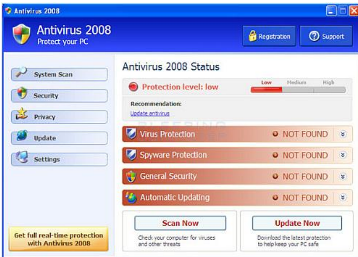
Egy hamis antivírus

Először is ezeket a csaló termékeket letöltő vevők kezdeti vesztesége 30 és 100 dollár (hatezer és húszezer forint) közé esik. Másodszor, ezek az ál-védelmi programok nem csak pénzt képesek kicsalni a felhasználóktól, hanem a vásárlás során megadott személyes és bankkártyaadatokat személyazonosság-lopáshoz vezető további csalásra is felhasználhatják, vagy a feketepiacon is értékesíthetik. Harmadszor pedig kártékony szoftverhez méltóan akár képesek a számítógépet is botnet hálózatba kötni, és a felhasználó erőforrásait a bűnözők rendelkezésére bocsátani.